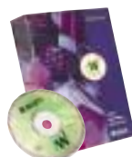
MarkWare™ (page 22)