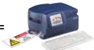
Globalmark Color & Cut